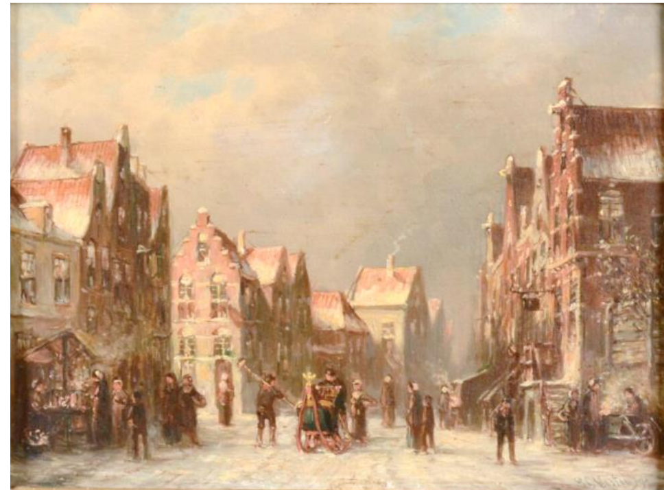
Titel: Wintergezicht in Amsterdam Maker: Petrus Gerardus Vertin Materiaal: olieverf op paneel Collectie: Stedelijk Museum Alkmaar